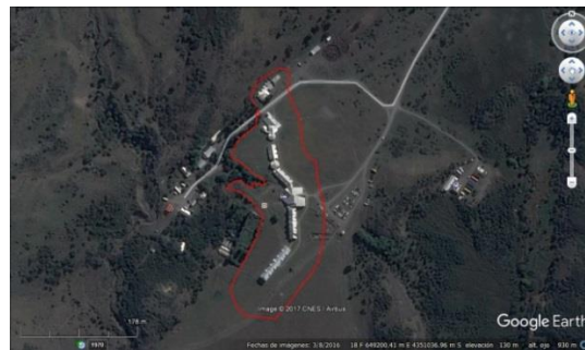
Figura 1: El entorno inmediato de la principal infraestructura del hotel está representado principalmente por pradera (área encerrada por una línea roja), encontrándose las fracciones de bosque de ñire en áreas más alejadas. Se pueden observar sectores claros con vegetación de pradera dominante y áreas oscuras correspondientes a bosquetes de lenga de altura no mayor a 3 metros y arbustos.

3) Que para efectos de esta fundamentación, se considerará como causas de efectos significativos adversos para las especies, situaciones y categorías de riesgo evidentes y claros, descartando las que consideran las menores probabilidades de afectar su condición poblacional de distribución o presencia y que pueda derivar en su desaparición o desplazamiento. Para esto se tendrán en cuenta las principales amenazas descritas para cada una de ellas como causas significativas para estimar efectos significativos a las especies, considerando que son las únicas posibles de considerar por estar respaldadas por estudios de largo aliento y aceptadas por la comunidad científica y la autoridad nacional.